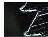
他社のステンレス製歯

Beaver Ring Cutterは米国製で、1960年代から50年余、世界各国の医療機関や救急隊で広く使用されています。この製品を製造販売するBeaver-Visitec Internationalは眼科治療用ディスポーザブル医療機器の開発製造及び販売会社です。日本国内にも子会社を設立して、薬事法の承認又は認証を受けた多くの眼科手術用ナイフ、カッター、注入針、焼灼器などを輸入販売しています。そのため、品質管理、販売後のアフターケアもメーカーとして直接責任をもって行う態勢を整えています。リングカッターの円鋸歯の材質は、眼科用ナイフとカッターの技術を存分に生かした、High Carbon Steel (高炭素鋼)を焼入れ加工することにより硬度を高めてあります。さらに工具用炭素鋼を使用したハイスピード型の高炭素鋼の高速歯も替歯として揃えています。宝飾店などで指輪を切る場合は、ステンレス製の円鋸歯のものが使用されていますが、救急現場には高炭素鋼の円鋸歯のご使用をお勧めします。